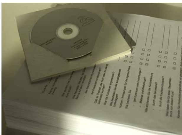
Auswertung 2007: 235 Fragebogen vom cbl ascona

Die Bologna-Reform ist die Neustrukturierung der Universitäten im europäischen Raum, mit dem Ziel der Vergleichbarkeit und damit der Erleichterung der Mobilität für die Studierenden. Lehrziele mussten expliziter und verbindlicher festgelegt werden. Die damit erreichte höhere Transparenz macht die Vorzüge des Lehrangebotes der einzelnen Hochschulen deutlicher sichtbar.