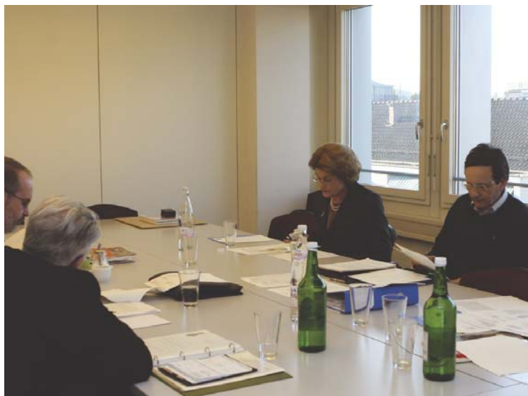
Das Organisationskomitee bei der Arbeit

Bereits einige Male hat das centro del bel libro mit grossem Erfolg den internationalen Bucheinbandwettbewerb „Prix Paul Bonet“ durchgeführt. Bei dessen Gründung stand dieser, auf anspruchsvollem Niveau angesiedelte Wettbewerb, allein auf weiter Flur. Inzwischen gibt es zahlreiche ähnliche Veranstaltungen. Deshalb ist 2003 der Wettbewerb des centro del bel libro ascona als „bel libro 2003“ neu positioniert und gleichzeitig für den bisherigen Schweizer Wettbewerb MfB für Buchbinderinnen und Buchbinder eine neue Plattform geschaffen worden.