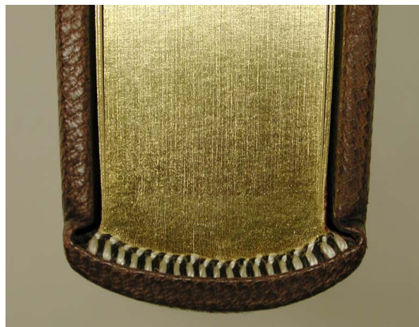
Ganzfranzband: Häubchen, Kapital, Goldschnitt